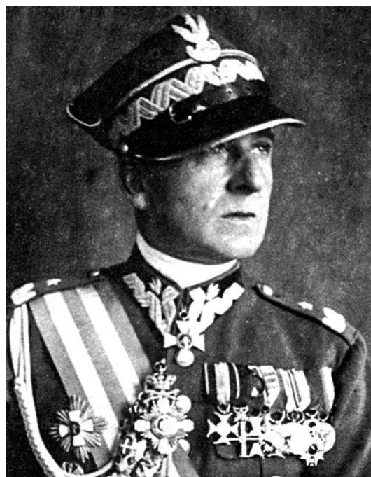
RYCINA 3. Bolesław Wieniawa-Długoszowski (1881–1942)