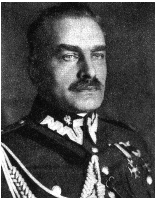
RYCINA 4. Felicjan Sławoj Składkowski (1885–1962)