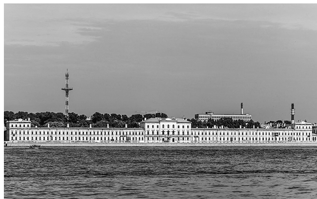
RYCINA 1. Kliniczny budynek najstarszej uczelni medycznej w Rosji, w której na początku XX w. wykładał K. Noiszewski. Akademia powstała pod koniec XVIII w., od 1881 r. nosiła nazwę Cesarskiej Wojskowej Akademii Medycznej w Petersburgu. W 1935 r. nadano jej imię Siergieja Mironowicza Kirowa

rosyjskich uczelni [6]. W 1900 r. uzyskał na tej uczelni tytuł doktora medycyny (ryc. 1). Tam również w latach 1908–1918 prowadził wykłady ze studentami, żywo działając w petersburskim Związku Polskich Lekarzy i Przyrodników.